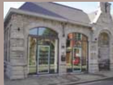
Avenue du Centre, 269 à ANDRIMONT