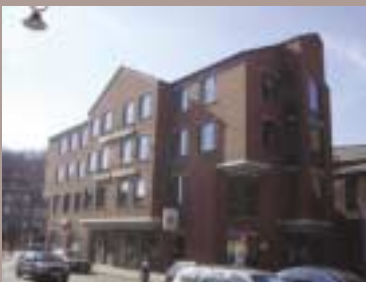
Rue des Ecoles, 2 à DISON

« Quand je pense à tous les livres qu'il me reste à lire, j'ai la certitude d'être encore heureux » Jules RENARD