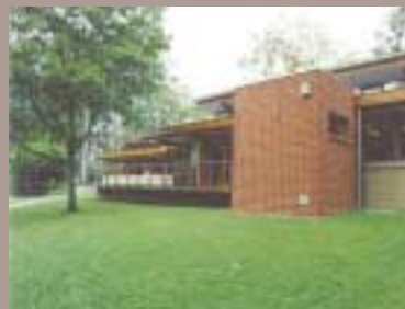
Rue de Verviers, 203 à ANDRIMONT